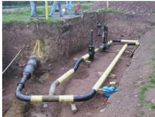
Erfassung der Einbauteile am offenen Graben