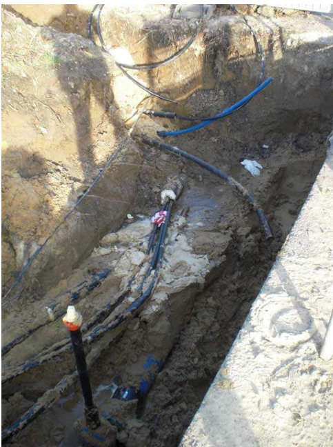
Einmessung am offenen Graben