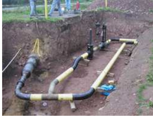
Erfassung der Einbauteile am offenen Graben