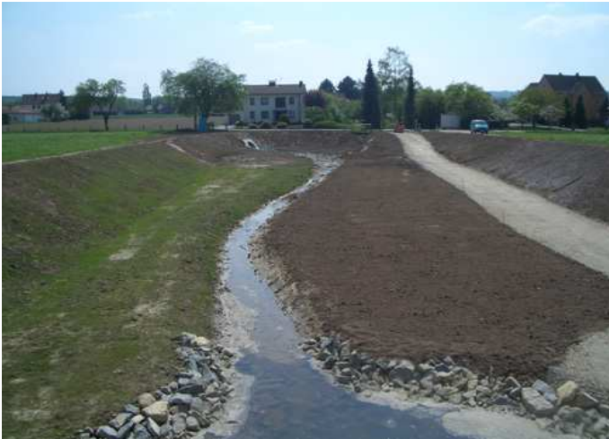
neues Regenrückhaltebecken (RRB)

Erstellung der Abrechnungspläne und prüffähigen Nachweise für die Bauabrechnung