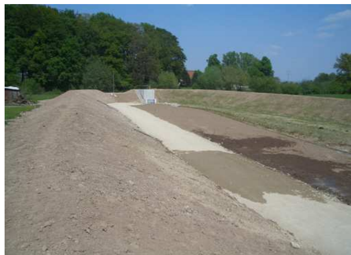
Abrechnungsplan für die Bauabrechnung